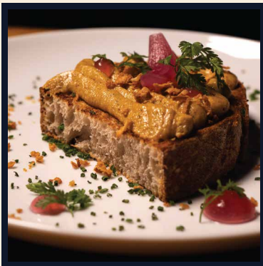
Domacia škvarková pomazánka, gél z nakladanej šalotky, čerstvý kváskový chliebík (1,7) 80g