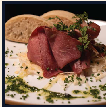
Variácie údenín, zelerový šalátik s chrenom, pažitka, ciabatta (1,7,9) 120g